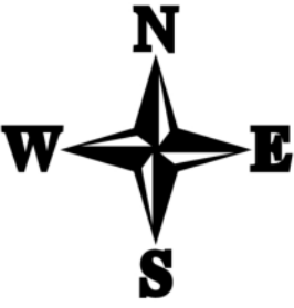
ОТОБРАЖЕНИЕ УСЛОВНОГО ЗНАКА ОБЪЕКТА