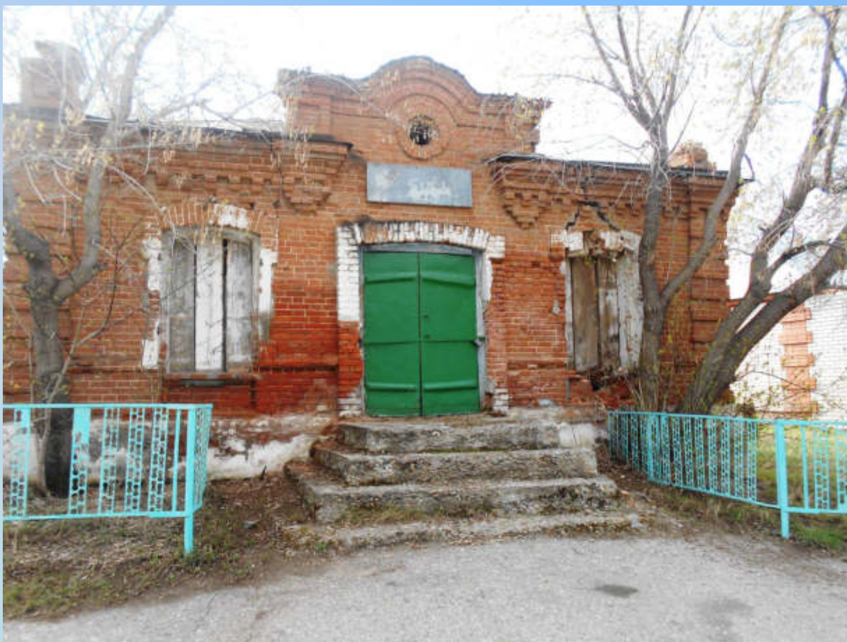
Здание купеческого магазина (лавка купца Ожогина). 2019 год (Ф-1. Оп.1. Ед.хр.772)

На территории села находится памятник градостроительства и архитектуры, занесенный в список объектов культурного наследия, расположенных на территории Алтайского края - здание купеческого магазина (лавка купца Ожогина). Он является образцом кирпичной постройки торгового здания начала XX века. Построено в 1901 году и до 1993 года в нем размещался магазин. В настоящий момент состояние памятника аварийное, он нуждается в проведении срочных ремонтно-реставрационных работ.