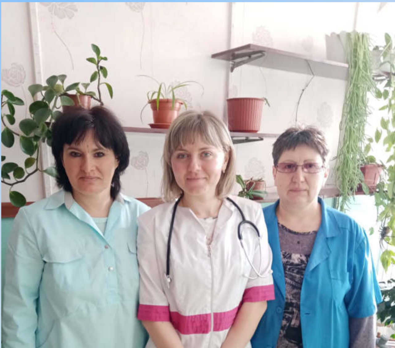
Коллектив фельдшерско-акушерского пункта Островновского филиала Мамонтовской центральной районной больницы. 2021 год (Ф-1. Оп.1. Ед.хр.825)