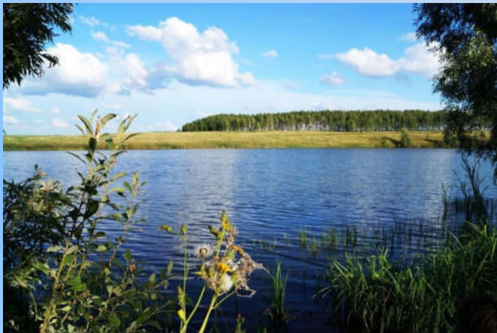
Пруд Семёновский. Общий вид. 2020 год (Ф-1. Оп.1. Ед.хр.789)

В восточной стороне в 2,7 км от села находится пруд Семёновский, в юго-восточной в 2,2 км - пруд Садовый.