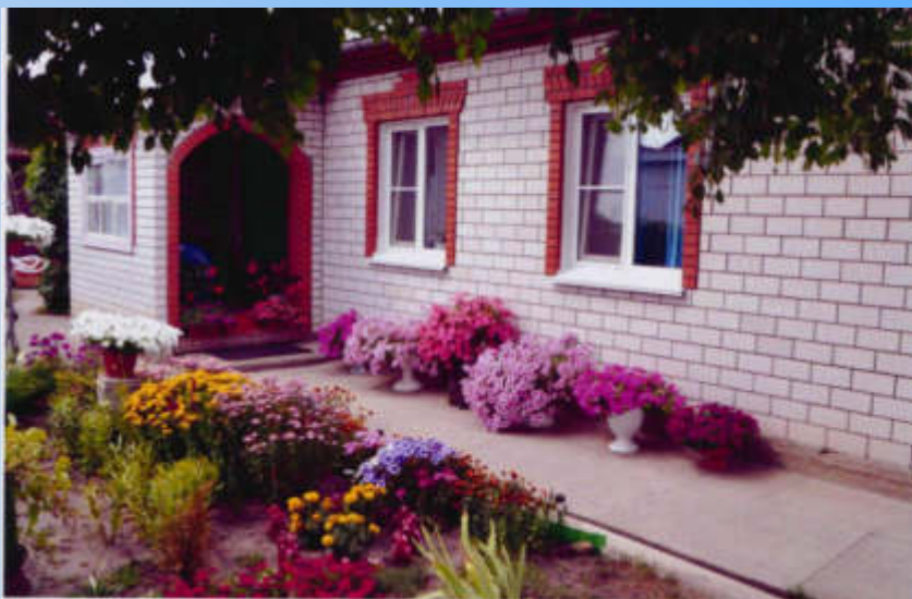
Общий вид усадьбы семьи Шмаковых Николая Петровича и Галины Сергеевны. 2019 год (Ф-1. Оп.1. Ед.хр.777)

В юбилейные даты образования населенного пункта проводятся праздники села, на которых чествуются жители, дома которых признаны домами образцового содержания, юбиляры, семейные пары, отмечающие юбилейную дату совместной жизни, семьи, в которых в этом году родились дети.