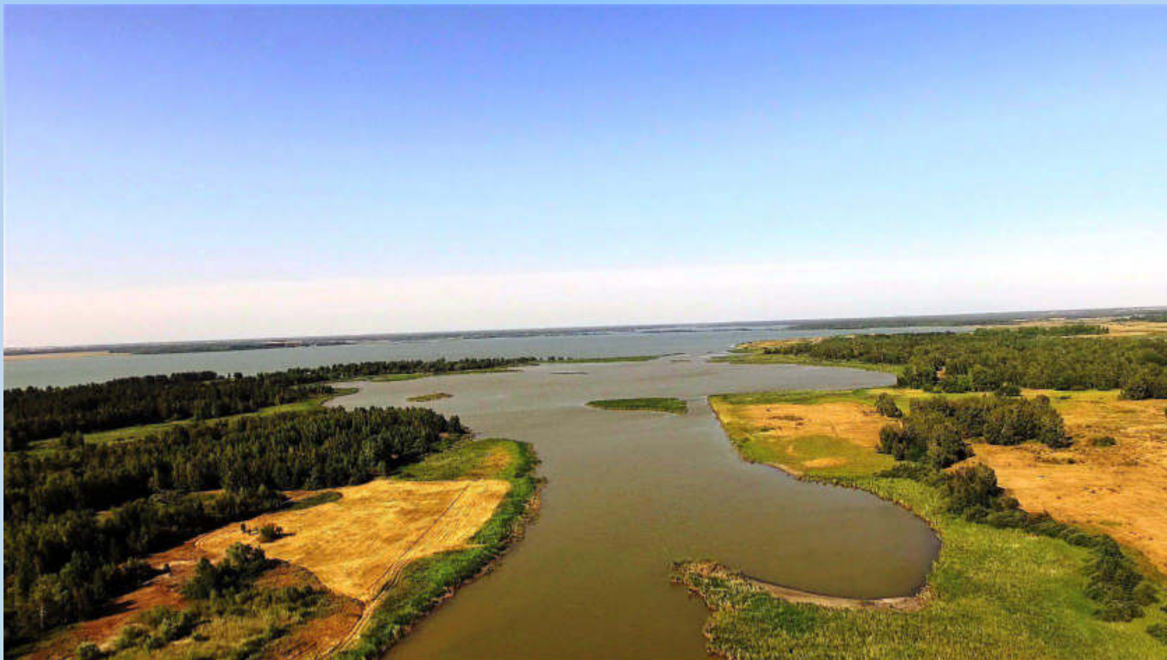
Речка Касмала и озеро Большое Островное в месте впадения речки. 2018 год (Ф-1. Оп.1. Ед.хр.770)

К северу от Островного расположено озеро Большое Островное и полоса Касмалинского ленточного бора, вдоль которого течет речка Касмала.