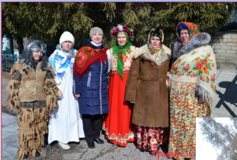
Сельские артисты на празднике «Проводы зимы». 18.03.2018 (Ф-1. Оп.1. Ед.хр.796)

Ежегодно проводятся Проводы зимы или народные гуляния «Масленица».