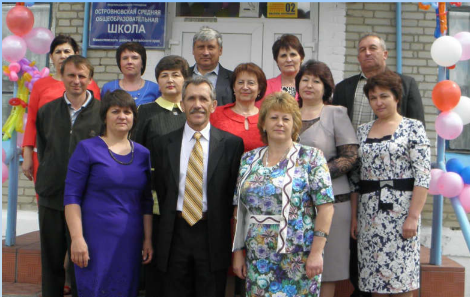
Коллектив Островновской средней общеобразовательной школы. 2018 год (Ф-1. Оп.1. Ед.хр.810)