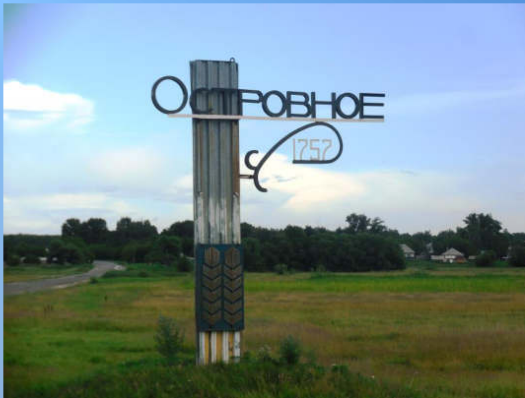
Стела при въезде в село Островное. Общй вид. 2017 год (Ф-1. Оп.1. Ед.хр.751)

Островное – первое село, появившееся на карте Мамонтовского района в далёком 1757 году.