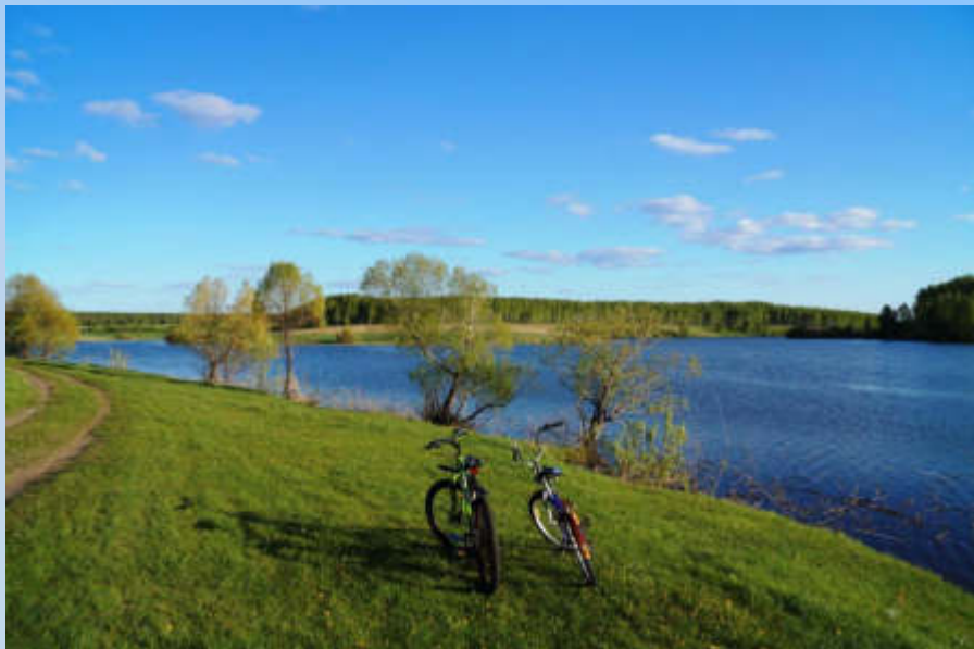
Пруд Зайцев. Общий вид. 2020 год (Ф-1. Оп.1. Ед.хр.790)

В черте села находится пруд Зайцев, болото Пантюха. В окрестностях села в восточной и юго-восточной стороне растут дубравы и колки.