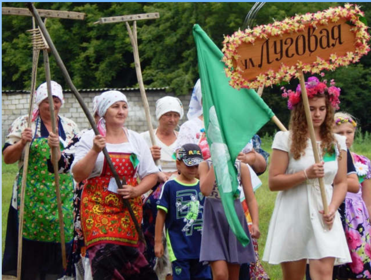
Жители ул. Луговая на празднике села. 2017 год (Ф-1. Оп.1. Ед.хр.794)

Делегации улиц, а их в селе 13, представляют свои улицы выставками рукоделия, цветов, номерами художественной самодеятельности. Ежегодно проводятся праздники улиц с выставками, праздничным концертом и награждениями (в 2018 году – праздник улицы Степная, в 2019 году – праздник улицы Енина).