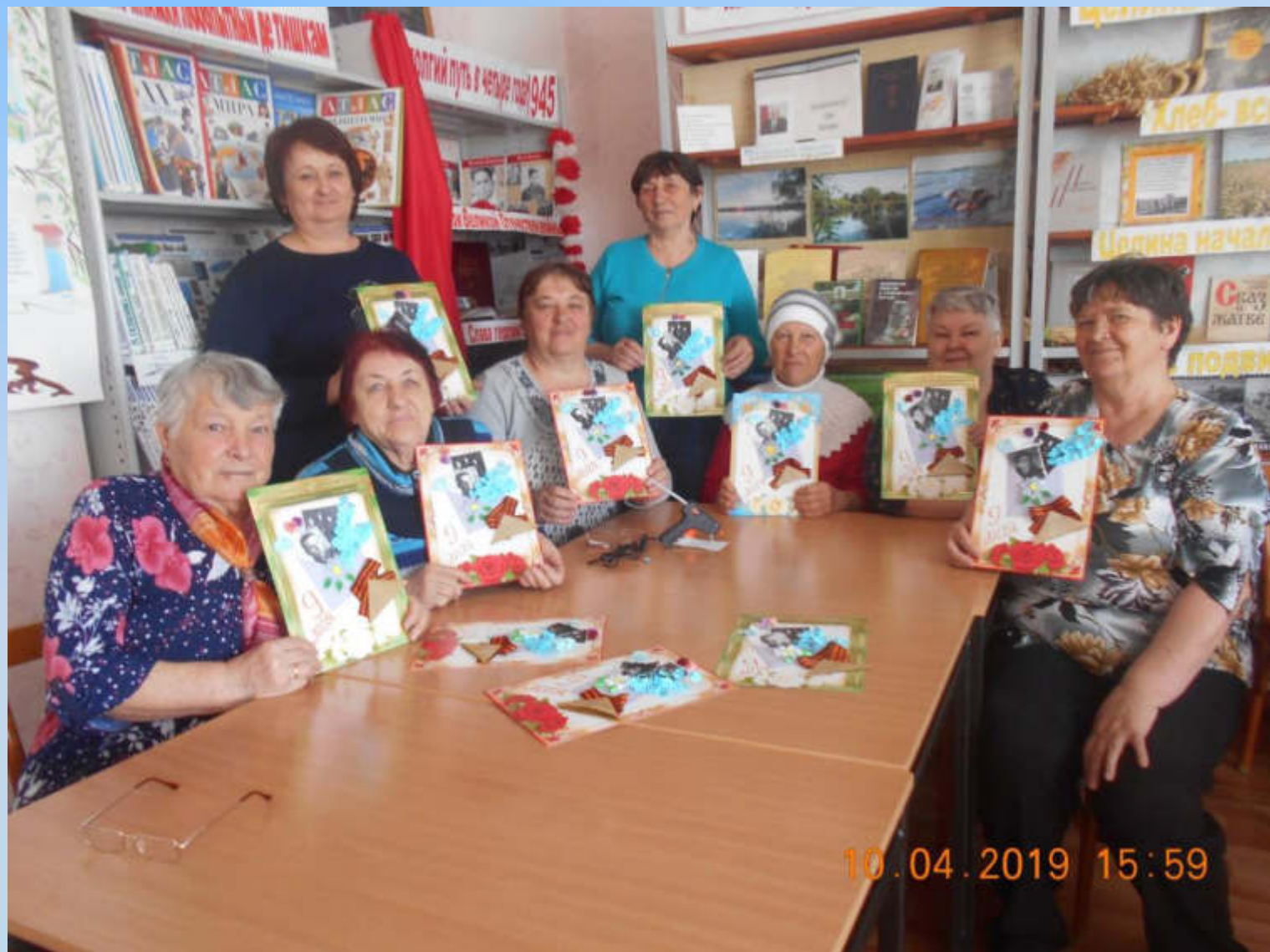
Члены Совета ветеранов готовят ежегодные памятные подарки в Островновской сельской библиотеке для тружеников тыла. 10.04.2019 (Ф-1. Оп.1. Ед.хр.816)