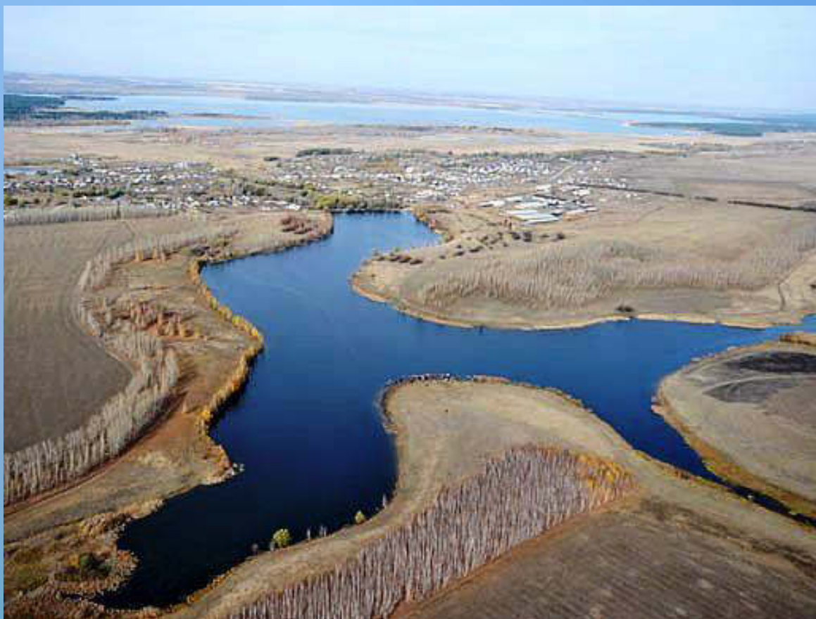
Село Островное. Вид сверху. 2018 год (Ф-1. Оп.1. Ед.хр.752)

От села до речки Касмала – кочки, между речкой и Касмалинским ленточным бором находится множество болот, на песках березовая роща.