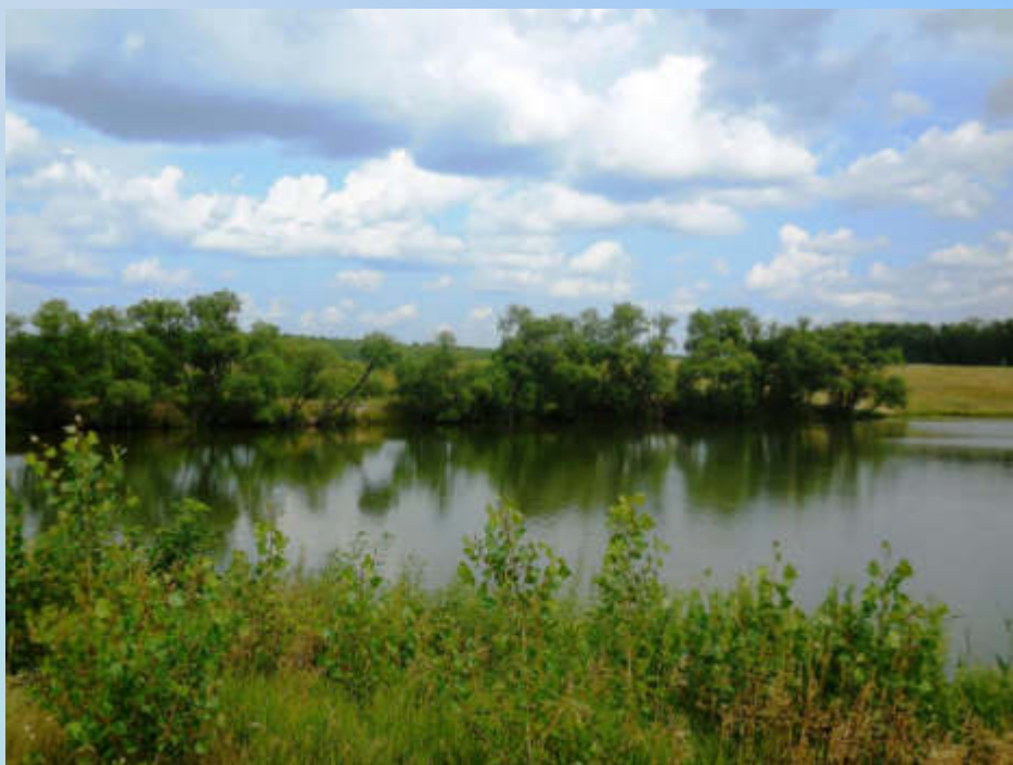
Пруд Садовый. Общий вид. 2018 год (Ф-1. Оп.1. Ед.хр.765)