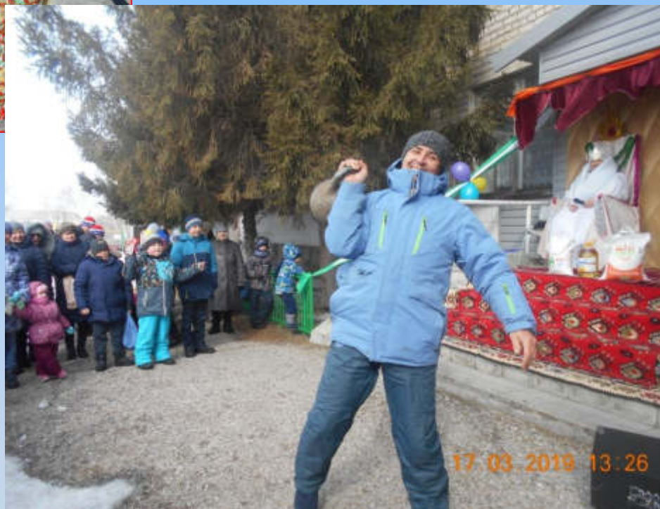
Конкурс силачей на народном гулянии «Масленица». 17.03.2019 (Ф-1. Оп.1. Ед.хр.800)